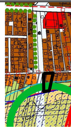
WYRYS ZE STUDIUM UWARUNKÓW I KIERUNKÓW ZAGOSPODAROWANIA PRZESTRZENNEGO MIASTA BIAŁA PODLASKA