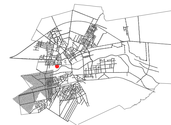
LOKALIZACJA TERENU OBJĘTEGO OPRACOWANIEM PLANU MIEJSCOWEGO W GRANICACH ADMINISTRACYJNYCH MIASTA BIAŁA PODLASKA